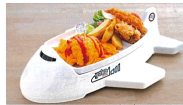
百里スカイキッズプレート