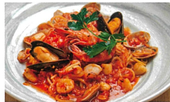
魚介たっぷりリペスカトーレ