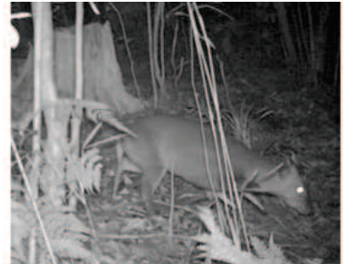
石岡市で確認されたキョン