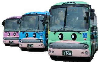
地理院地図 GSI Maps