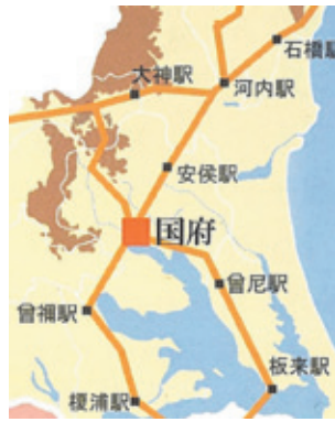
古代常陸国の官道