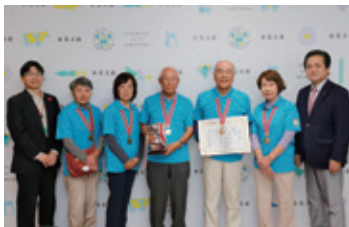
ワナゲ種目:北浦シニアクラブ