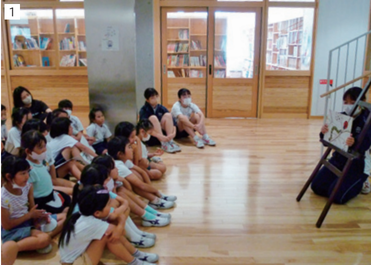
1 お話の広場(紙芝居)