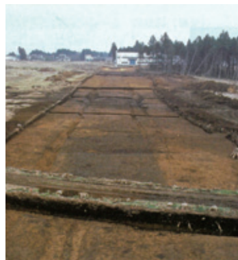
発掘された五万堀古道(笠間市)