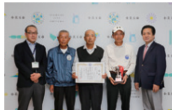
ゲートボール種目:おみたまクラブ