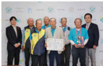
クロッキー種目:おみたまにじいろクラブ

第28回茨城県健康福祉祭いばらきねんりんスポーツ大会（開催地：笠松運動公園）のクロッキー、ワナゲ、ゲートボール種目で老人クラブなどの市内3団体が優勝しました。クロッキー種目は昨年に引き続きの優勝を果たし、連覇を成し遂げました。