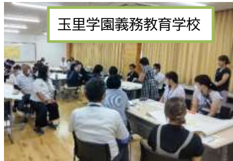
玉里学園義務教育学校