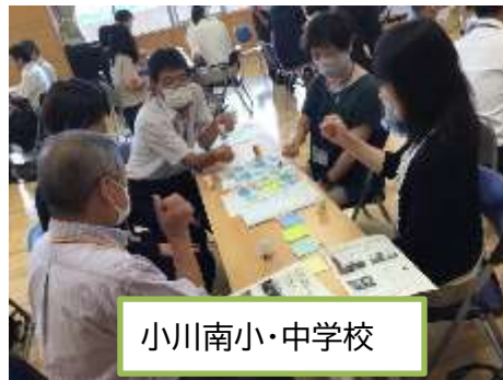
小川南小・中学校