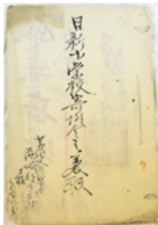
日新小学校寄附金之義願 (小川資料館蔵)

や上吉影村副戸長ら数名が名を連ねています。日新小学校は明治7年(1874年)、現在の茨城町下雨ヶ谷にあつた寺院を学校と定めた、上吉影小学校の前身にあたる小学校です。この年は学区である上吉影・佐才の村民からも、小学校維持のため寄附金が集められています。