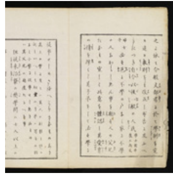
「学制」(一部)