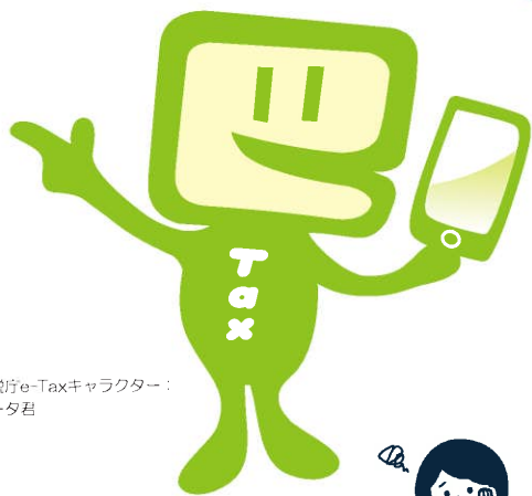
国税庁e-Taxキャラクター： イータ君

国税の場合はe-Tax、地方税の場合はeLTAXを利用して、事前に届出をした預貯金口座からの振替により、簡単な操作で税金を納付することができる便利な電子納税の手段です。