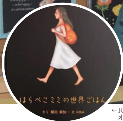
←RIKAさんが絵を担当し出版された絵本「はらぺこミミの世界ごはん」。県内書店およびネット書店で販売中。オイルパステルを指で混色する技法による絵本出版は日本初。