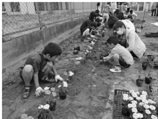
子どもから大人までみんなで活動しています