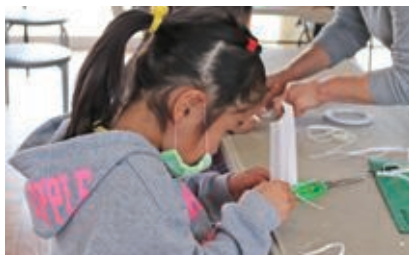
羽鳥小学校学童クラブの子どもたちに障子紙マスクの作り方をレクチャー

マスク不足で困っている人の役に立ちたいと、障子紙を使ったマスクを考案。破れにくく湿気にも強い強化紙という障子紙が使えるのではと考え、衛生的に問題ないかをメーカーに確認して製作。教育委員会や商工会、保育園、学童クラブ、介護施設、動物病院等に寄付いただいています。