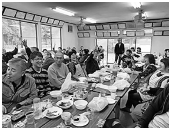
三世代交流会（張星区）

4月18日に区長会長に選任されました。新型コロナウイルスの影響で緊急事態宣言が発令される中、拡散防止対策として紙面総会という誰もが予測しえない状況の中でのスタートとなりましたが、このような時こそ地域やコミュニティの絆を最大限に活かす時だと感じています。そのためにも、みなさんのより一層のお力添えをいただき、この危機を乗り越えていきたいと思っております。