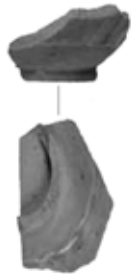
写真2 出土遺物(陶器)

問い合わせ 生涯学習課(生涯学習センターコスモス内) ☎ 0299-26-9111