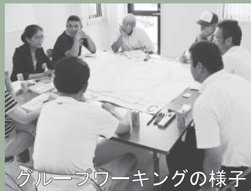
グループワーキングの様子