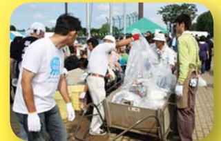
会場を常にキレイに！ 会場クリーンアップ 作戦の様子

希望ヶ丘公園をいつまでも美しいまま利用していきたいとの思いから、まつり当日、各バザー出店団体の協力のもと会場のクリーンアップ作戦を実施しました。午前11時から午後8時まで、1時間ごとに各出店団体から2名のボランティアの方が会場全体のゴミ拾い・ゴミ集めをしてくださいました。ありがとうございました。