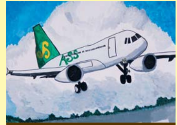
金賞 土屋 雅輝 (玉里)