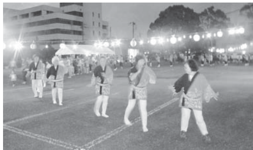
元気な玉里北小区をつくる会 (夏祭り) H23.7.31