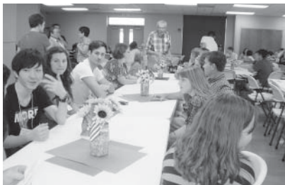
アビリンで盛大に行われた歓迎会

Hello again everyone! This July, I helped escort a group of Omitama students to Abilene (where I'm from!) as a part of the Sister City activities. We did so many things that I won't be able to tell you about all of them at once, so I hope you enjoy this first part of a three part series.