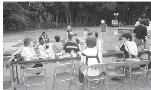
与沢地区 (ふれあい夏まつり) H23.8.6