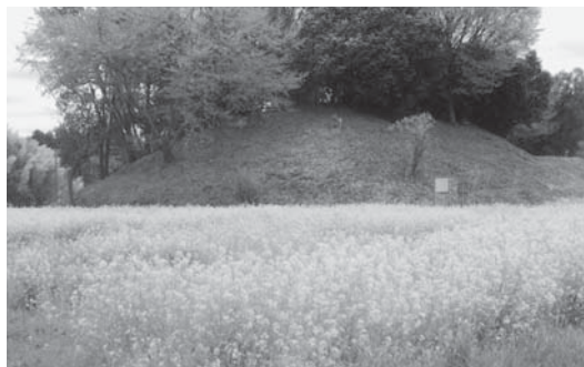
羽黒古墳公園の菜の花畑

竹原区では、「羽黒古墳公園、大正地池畔の保全と環境美化」をまちづくり活動のテーマとし、区会議員を中心に全住民で次の活動に取り組んでおります。