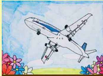
金賞 長谷川 夏凧 (堅倉)