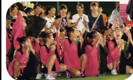
ジュニアの部 みのり新体操クラブ