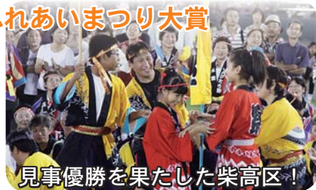
見事優勝を果たした柴高区!