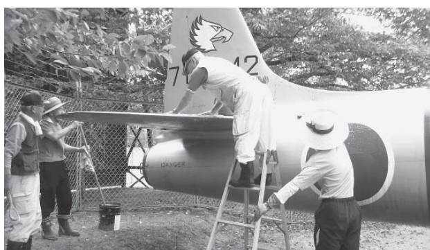
ジェット機の清掃に取り組む自衛隊OBの皆さん

清掃を終えた皆さんは「この展示機は、航空自衛隊パイロットの育成と、同機を整備する隊員の教育養成等に多大な貢献をしてきた名機であると感じています。この高齢ジェット機の若年期雄飛を想像して眺めていただければ」と話していました。