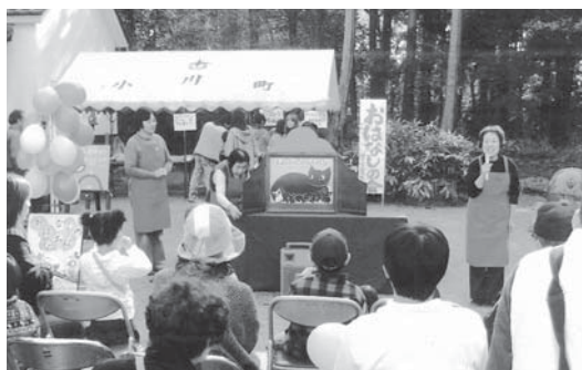
昨年の文化祭では紙芝居を披露

私たちは、有志17名による朗読ボランティアの組織です。幼稚園や小学校、老人ホーム等の施設を訪問し、朗読や紙芝居の披露を行っています。また、各地区の行事にも参加し、お話し会を開催したりもしています。