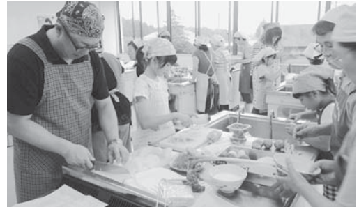
親子で協力して作る料理は味もバツグン