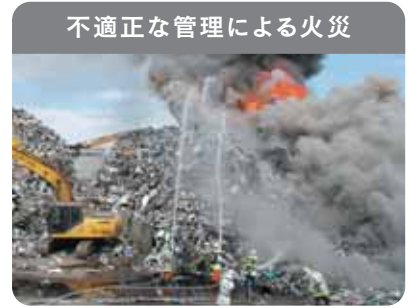
不適正な管理による火災

廃家電は電池やプラスチックを含むため、発火・延焼の危険性があり、不適正な管理による火災が発生しています。