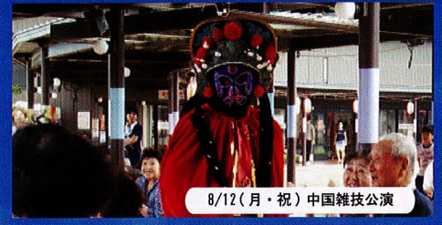
8/12(月・祝) 中国雑技公演