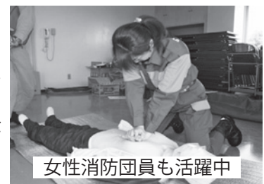
女性消防団員も活躍中