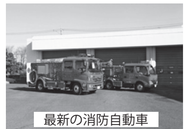
最新の消防自動車

また、5年以上勤務された方にはその勤務年数と階級に応じた退職報奨金が支給されます。また他にも、公務災害補償、被服の貸与、表彰制度等があります。