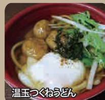
温玉つくねうどん