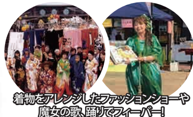
着物をアレンジしたファッションショーや 魔女の歌、踊りでハイパー!