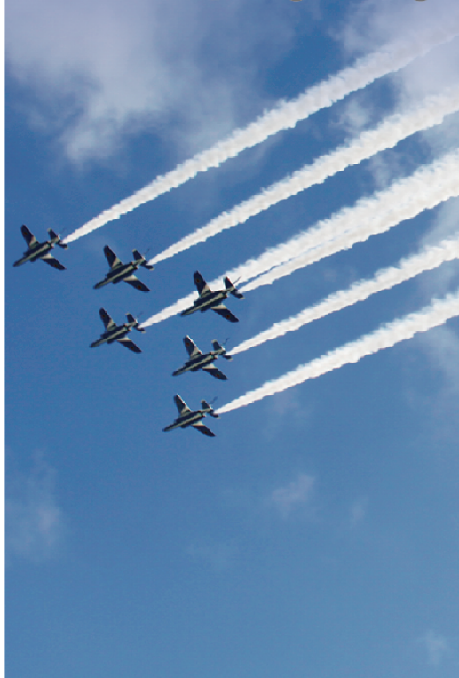
Omitama Guide Map