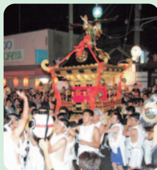
小川の祇園 (23日撮影)