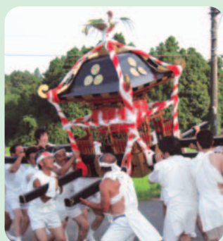
野田のまつり (29日撮影)