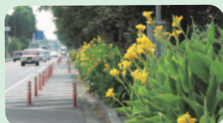
国道6号沿いのカンナ (25日撮影)