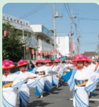
羽鳥まつり (30日撮影)