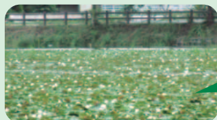
池花池のヒツジグサ (20日撮影)