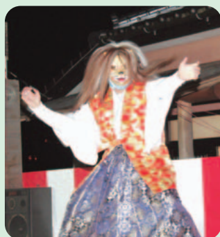
佐才のまつり (29日撮影)