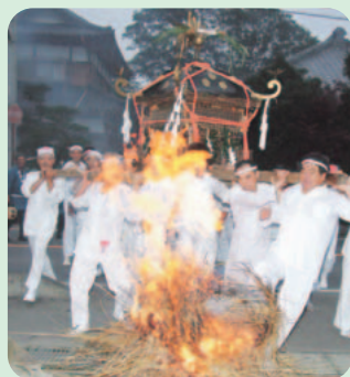
竹原アワアワ祇園 (22日撮影)