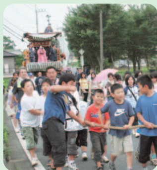
下吉影のまつり (16日撮影)