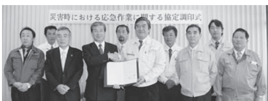
島田市長と内藤会長がしっかりと握手を交わしました

協定調印式では、島田市長が「地元の建設業社の方々に協力いただけるのは、市民の安全安心のために大変心強いこと」とあいさつを述べました。それに対し、内藤会長も「もしもに備え、迅速かつ円滑に協力できるような体制づくりを強化してがんばりたい」と話し、協定書に署名を行いました。