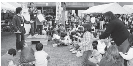
豪華景品をゲットだ！(おたのしみ大抽選会)