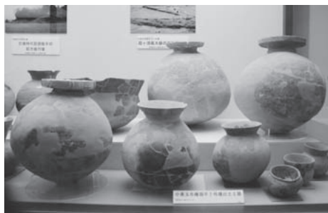
現在、展示されている権現平2号墳出土土器

【小美玉市教育委員会 生涯学習課 ☎26-9111】 (次回の掲載は2月号です)