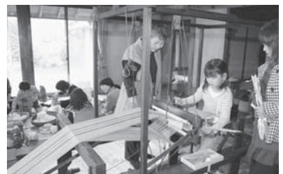
「わたづくり」や「はたおり体験」(げんきっこ体験教室)