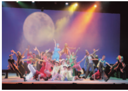
▲ティーンズミュージカルSAGA(佐賀県)