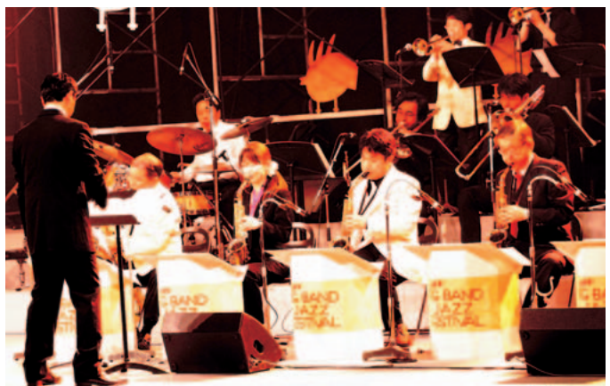
▲IBARAKI SUPER BIGBAND