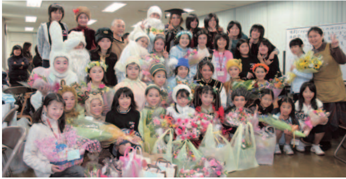
▲初日の公演を終えて「演劇 Crew Cosmo's」の皆さん