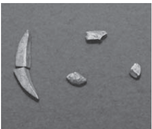
紡錘形石製品の破片

を、まさに塗り替えるような調査成果で、当時は大変ショッキングなニュースであったようです。