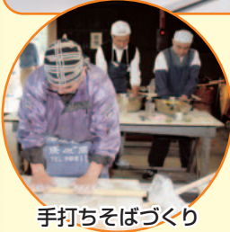
手打ちそばづくり