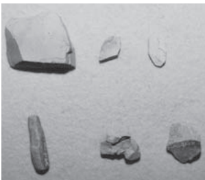
グリーンタフ製の剥片

まず土器ですが、多くの土器が出土したなか、東海地方の影響を著しく強く受けた土器が出土したのです。茨城の場合、古墳時代には南関東などの他地域から、人や文化、新しい技術が移ってきていると言われています。ただ、この権現平2号墳の発掘調査が行われるまでは、一部、東海地方や畿内地方、北陸地方のものが出てきましたが、圧倒的に南関東のものが多く、それらの地方のものは、南関東の人たちを経由して、茨城に入ってきたものだと考えられていたのです。しかし、権現平2号墳で東海地方の土器が中心に出土しました。これにより、南関東だけでなく東海地方の人たちも、この霞ヶ浦の地に移り住んできており、その中から、初期の有力首長が誕生していることが分かったのです。