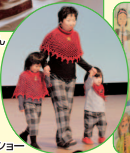
編み物▶ ファッションショー