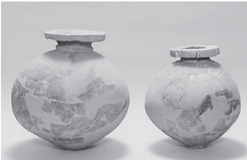
常設展示されている、権現平2号墳から出土した土器 (東海地方の土器の影響が強く出てます)

現在、生涯学習センターコスモスで、福祉につきりまつりやこどもまつりが行われる際、臨時駐車場として利用されている空き地(通称権現山駐車場)は、もともと4基の古墳があり、平成2年に発掘調査が行われました。この発掘調査で、実は、それまでの茨城県や霞ヶ浦沿岸域の歴史を塗り替えるような大きな発見があったことは、あまり知られていません。