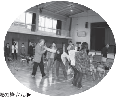
護身術を学ぶ東っ子守り隊の皆さん▶

学校からの呼びかけに、今年新たに協力を申し出たご夫妻は、「この子どもたちは、とってもよくあいさつをしてくれるんですよ。子育てを終えてから、このような形で、地域の子どもたちを見守ることができてうれしいです」と優しい眼差しで話してくれました。