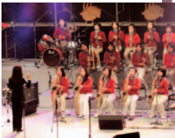
▲石神小学校 Little Blue Stars(東海村)