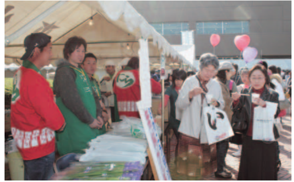
▲おもてなしコーナー

演劇祭では、佐賀県、埼玉県、鳥取県、東京都からアマチュア演劇団体の出場があり、各劇団の個性溢れる演劇が披露されました。小美玉市の劇団「演劇 Crew Cosmo's」も茨城県の代表として2日間2公演を行い、5月から練習を積み重ねてきた『森は生きている』をみごとに上演し、客席からは惜しめない拍手が送られていました。