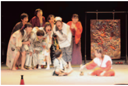
▲みやしろ演劇パーティ(埼玉県)