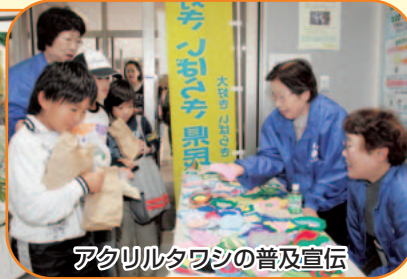
アタリルタワシの普及宣伝