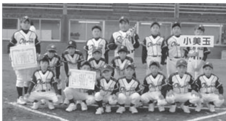
小美玉リトルリーグ

小美玉リトルリーグは、30年前に地域の子どもたちに「友情・勇気・努力」の精神を養成することを目的に結成され、修了生はこれまでに約300名になります。リトルリーグの運営は全てボランティアで行われ、世界大会への出場を目標として、日ごろから練習に励んでいます。