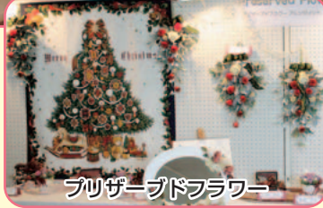
ブツザブツフラワー