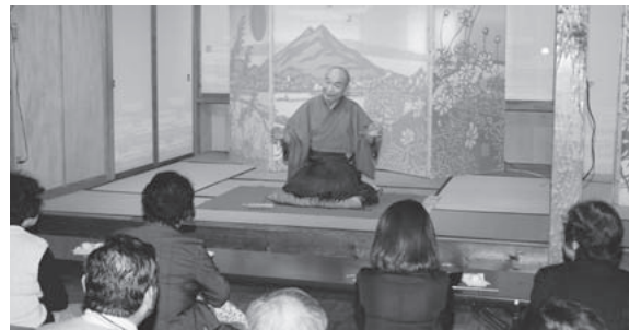
間近で聞く落語は、迫力満点!

11月17日から21日にかけて毎夕午後5時から、しみじみの家で「うさぎまつり 2008 トーローまつり」(NPO法人玉里しみじみの村主催)が開催されました。