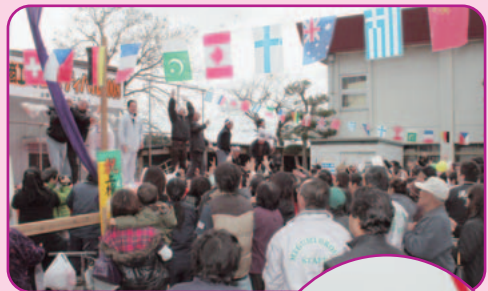
▶祝上棟もちまき大会