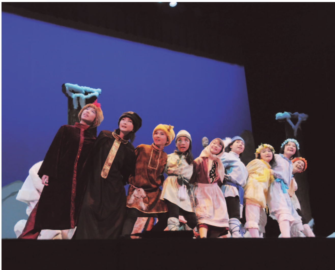
『森は生きている』を上演する“演劇 Crew Cosmo's”