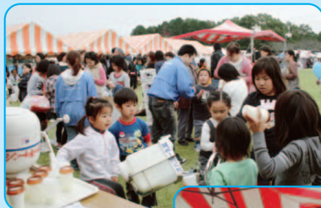
▶手作りバター教室