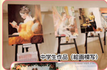
中学生作品 (絵画模写)