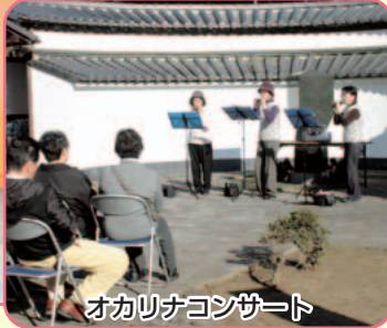
オカリナコンサート