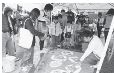
ゲームにチャレンジ!!(ちゃれんじ広場)